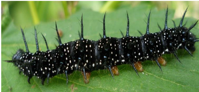
Raupe des Tagpfauenauges

Die namensgebenden großen Augenflecken dienen als Schutz vor Fressfeinden. Bei Gefahr werden die Flügel ausgebreitet, um dem Feind anzudeuten, er wird von einem großem Tier bedroht. Mit zusammengeklappten Flügeln sieht das Tagpfauenauge wie ein trockenes Blatt aus und ist kaum wahrzunehmen.